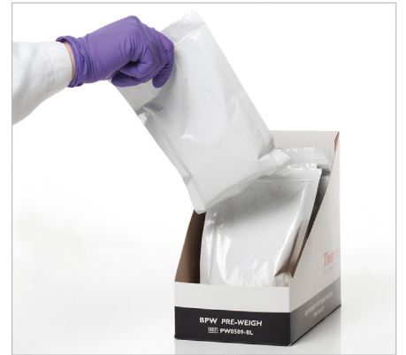
Pre-Weigh DCMs: supplied in shelf-ready boxes

1리터 및 8리터 파우치를 조합하여 필요한 배지 용량을 맞출 수 있습니다.